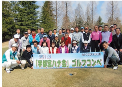
宇都宮ハナ会ゴルフコンペ (2014.4.9)